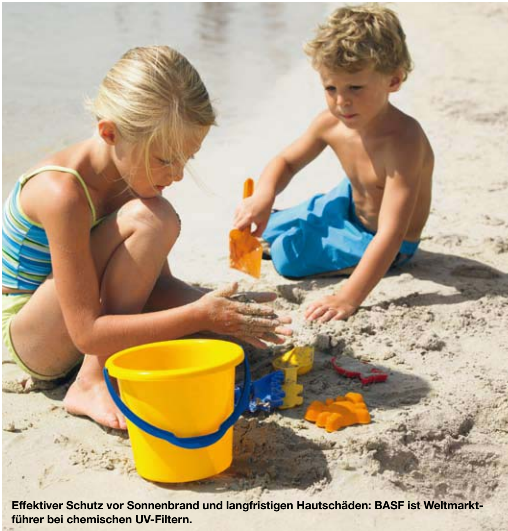
Effektiver Schutz vor Sonnenbrand und langfristigen Hautschäden: BASF ist Weltmarktführer bei chemischen UV-Filtern.

→ Mehr zur Integration von Ciba ab Seite 58