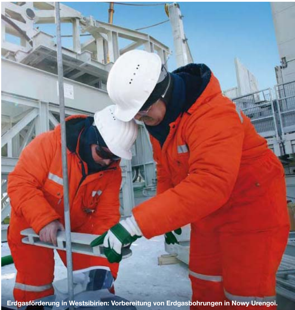
Erdgasförderung in Westsibirien: Vorbereitung von Erdgasbohrungen in Nowy Urengoi.